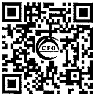
2023年中高级继续教育报名

第一步：报名缴费【扫描二维码进行选班>>填写开票信息、学员信息>>选择上课方式>>提交后自动跳转微信支付】