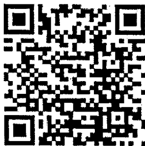
2023年中高级继续教育学号查询

报名缴费完成后3-5个工作日，可扫描以下二维码，输入报名时填写手机号码查询学号及核对报名信息， 查到学号视为报名成功!